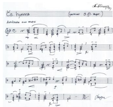
Česká hymna pro tři zobcové flétny (2013)