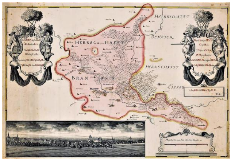
Mapa brandýského panství z roku 1721