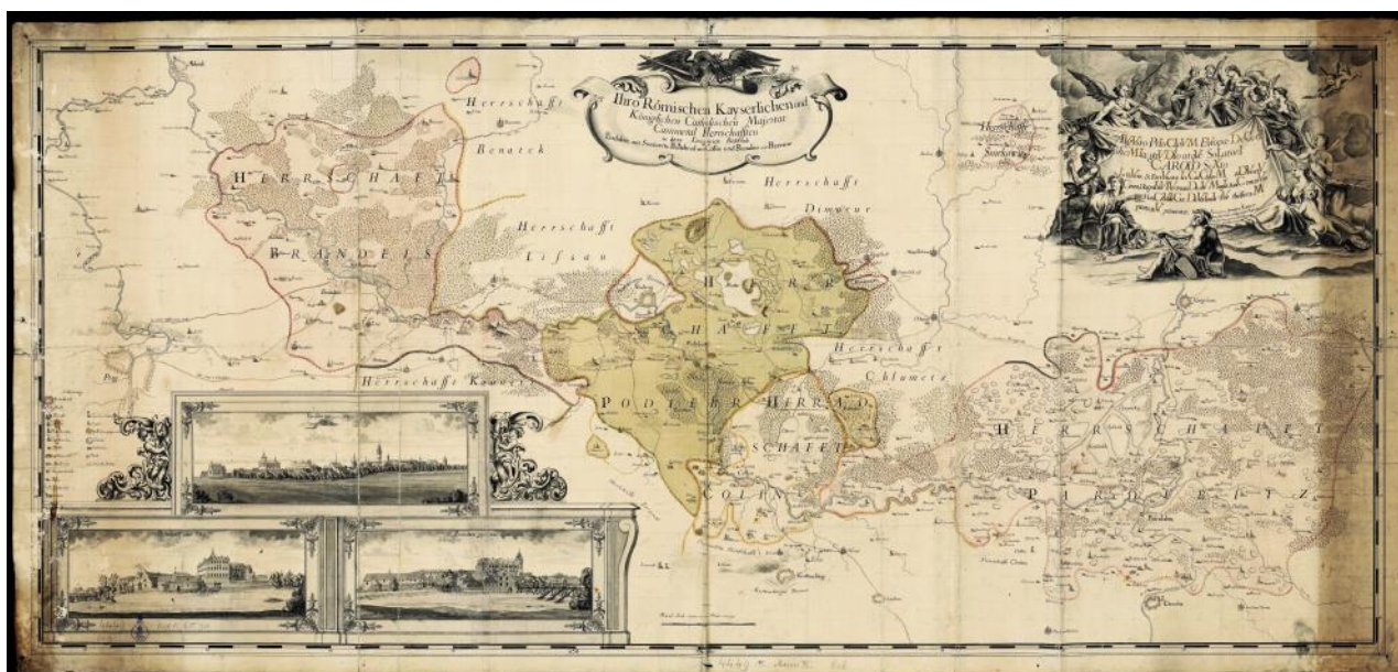
Mapa brandýského panství z roku 1723 (Rakouská národní knihovna)

na Nymburk a Hradec Králové. Jiná zobrazená varianta polské cesty za Radonicemi neuhýbala k severovýchodu a vedla dále na východ přes Nehvizdy, Mochov a Sadskou do Poděbrad (od 18. století jedna z hlavních zemských silnic, tzv. Landstrassen ).