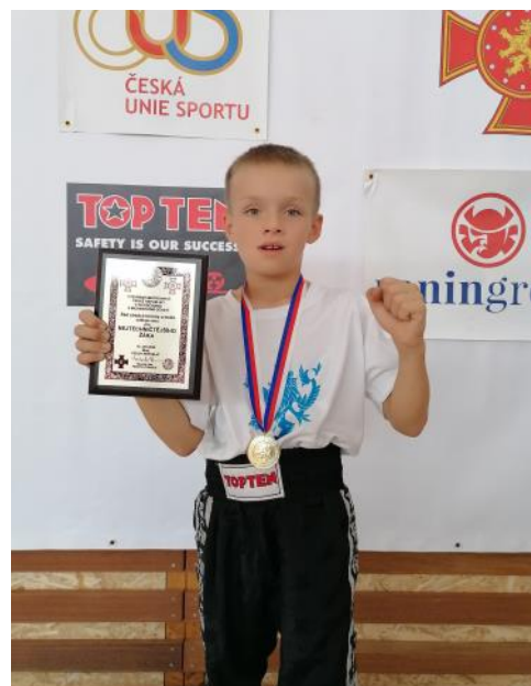
Mistr České republiky v kickboxu Tommy Kazda