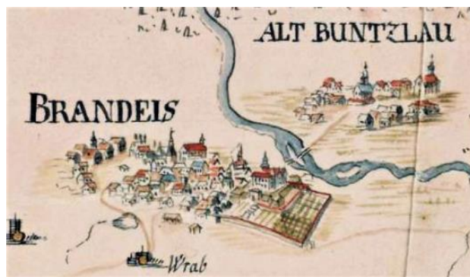
Brandýs a Boleslav na mapě brandýského panství z roku 1721