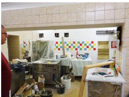
Kuchyň uprostřed rekonstrukce

S administrativními změnami přišla i změna organizační struktury tak, že Slatinné lázně Toušeň nyní spadají přímo, bez mezičlánků, pod ředitelství Fakultní nemocnice. Tím máme větší kompetence i větší finanční limit, což se už promítlo do možností stavebních úprav, které jsou v běhu.