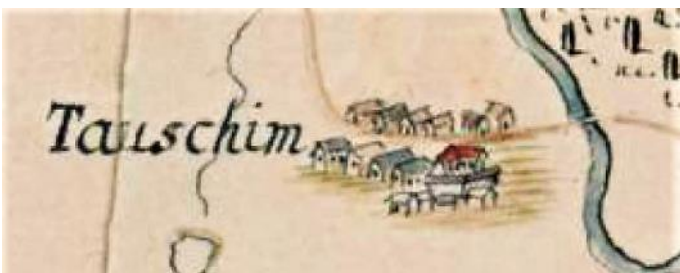
Toušeň na mapě brandýského panství z roku 1721

uhýbá na Čelákovice, kde překračuje Labe brodem v místě Bodláková přivozu (u dnešního železničního mostu). Je možné, že se tu převáželo již v době vzniku mapy – problematika čelákovických labských brodů, podobně jako opevnění městečka, není vyjma několika nedoložených zmínek zatím objasněna. Cesta pokračuje přes Lysou