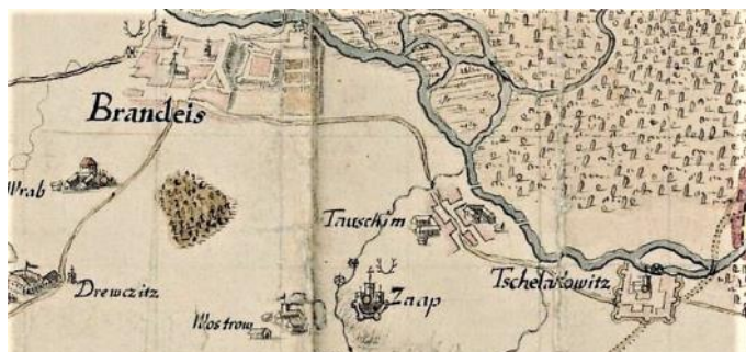
Výřez z mapy z roku 1723

Mnohem důkladněji než na starší mapě jsou znázorněny cesty . Od Prahy, jež je tu též zakreslena, na Brandýs vedou cesty dvě, původní stará okolo Popovic i mladší cesta kolem či přes Kbely, Vinoř, Dřevčice a Vrábí. Brandýs, Toušeň a Čelákovice spojuje úsek lipské cesty, která pokračovala dále na Mochov a Kolín. Z Prahy vede jedna z variant slezské (polské) cesty, která mezi Radonicemi a Nehvizdy