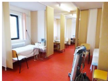
Elektroléčba nově vybavena

Kdokoli do Toušeň přijde, pocítí klid. Je tu pozitivní prostředí. Pozitivní duch. Starosvětské lázně s naprosto moderním vybavením, kolonáda, park, slatina jako rodinné stříbro . Na tom Toušeň stojí. V prvním kroku jsme se snažili lázně trochu vylepšit. Těším se na klienty, kteří sem jezdí opakovaně: