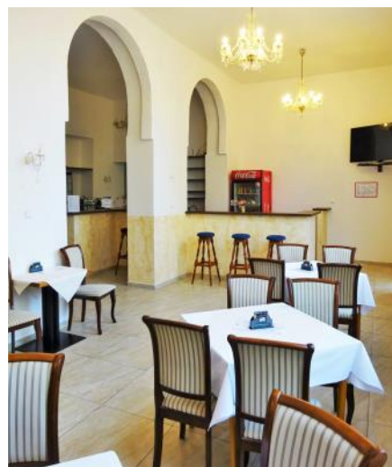
Lázeňská kavárna čeká na nové hosty