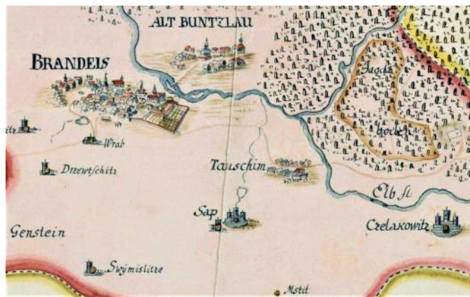
Výřez z mapy brandýského panství z roku 1721