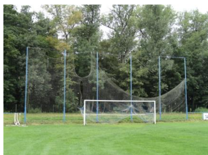
Ochranné sítě před rekonstrukcí

Jak to tedy půjde dál? Máme v plánu fotbal v obci zachovat, tento výbor a všichni hráči se o to budou snažit. Je sice pravda, že v minulé sezóně jsme měli dva dospělé týmy A i B, žáky i přípravku a letos pouze jeden tým. Přípravku vedeme a trénujeme, ale není přihlášená v soutěži a doufáme, že se v příští sezóně opět objeví v okresních tabulkách. Máme naplánováno i modernizování hřiště, ale