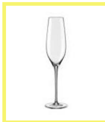
Sklenice na šumivá vína

Šumivá vína by se měla podávat v píšťalách, vysokých štíhlých sklenicích s rovnými stěnami, které napomáhají zachování pěny a perlení. Staré sklenice miskovitého tvaru, jsou nevhodné, protože větší plocha umožňuje větší rozptyl bublinek a víno rychleji vyšumí.