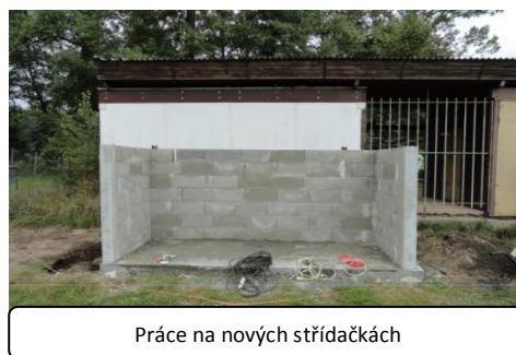
Práce na nových střídačkách