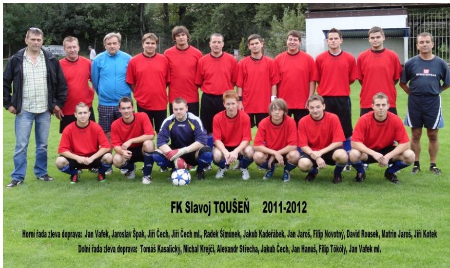
FK Slavoj TOUŠEV 2011-2012