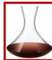
Karafa na víno

Alkoholizovaná vína by se měla podávat v menších, užších verzích obvyklých sklenic na víno, protože se tak přiznává jejich větší alkoholická síla. Nepoužívejte ale nejmenší likérové skleničky protože neposkytují dostatek prostoru na vychutnání vůně těchto vín.