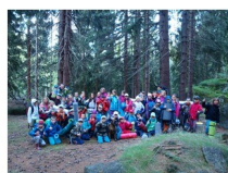
Nocování pod širákem..