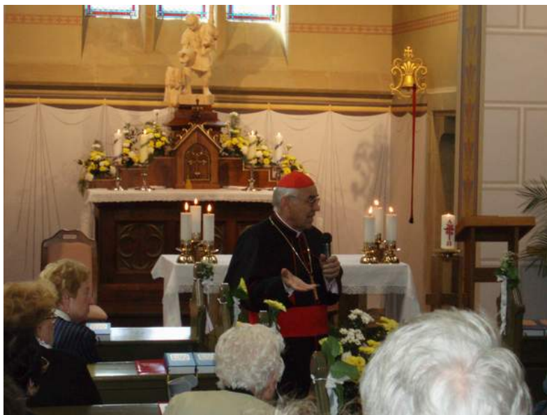
Kardinál Miloslav Vlk při diskusi s občany po celebrování slavnostní mše u příležitosti kompletní opravy kostela

Při budování plynovodní přípojky bylo zjištěno, že kostel je majetkem obce. Všichni víme, v jakém stavu kostel byl. Vzhledem k celkovému stavu střechy nemělo již význam provádět menší opravy. Po dlouholetém zatékání byla zničena fasáda a interiér kostela. V roce 2004 obdržela obec státní dotaci od Ministerstva pro místní rozvoj ve výši 1,198.989,- Kč na rekonstrukci střechy kostela a částečnou rekonstrukci dalšího kousku veřejného osvětlení. Práce na opravě střechy včetně klempířských prvků byly zahájeny a ukončeny v roce 2004. V roce 2005 a 2006 byla provedena rekonstrukce fasády kostela a rekonstrukce interiéru. Na rekonstrukci fasády byla obci přiznána Ministerstvem pro místní rozvoj státní dotace ve výši 639.000,- Kč.