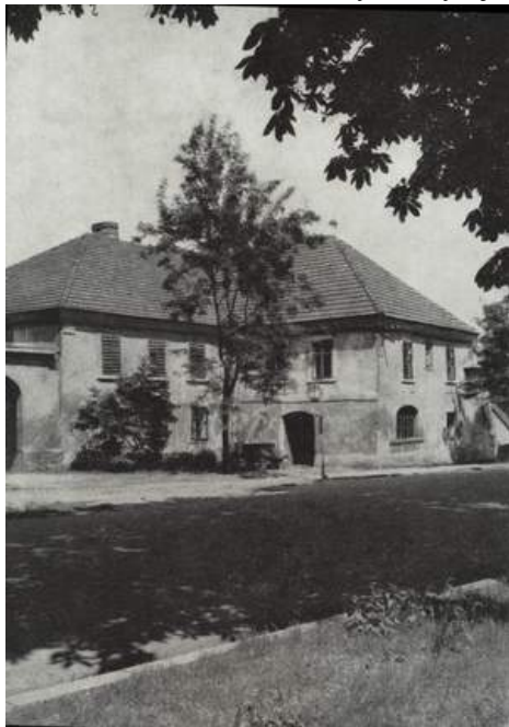
foto od Marie Hartmannové – pozn. red.). V té době čítala Obec baráčníků téměř 450 členů a prožívala nejplodnější léta své činnosti. Od roku 2003 sídlí rychta v Požární ulici v Hasičském domě, ve schůzovní místnosti dnes již zaniklého spolku dobrovolných požárníků. Obrázky na schodišti dodnes dokumentují, kolik lidí při výstavbě tohoto objektu ochotně pomáhalo.

Nejinak tomu bylo i v toušeňské baráčnické historii. První rychtou od založení spolku v roce 1898 byla nálevna hostince U Salačů /nyní U Wallianů / a v sále v prvním patře se konaly první baráčnické bály a merendy. Později se rychta přestěhovala na druhou stranu ulice do tehdejší hospody U Davidků. V padesátých letech minulého století se baráčníci a rychta opět stěhovali – tentokrát do bývalého výčepu hostince U Choděrů na návsi, který předtím vyklidila jídelna státního statku (viz