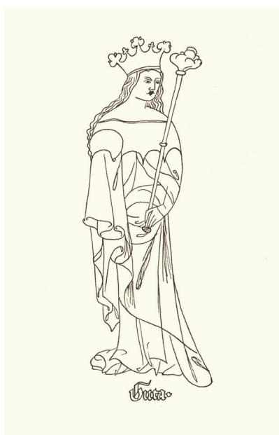
Guta Habsburská na ilustraci z jhlavského rukopisu Zbraslavské kroniky, konec 14. století, upravil Jan Králík.

Použitá literatura: Vladimír Salač (ed.), Atlas pravěkých a raně středověkých hradišť v Čechách , Praha – Schleswig 2019; Josef Žemlička, Čechy v době knížecí , Praha 1997; Jan Klápště, Proměna českých zemí ve středověku , Praha 2005; František Kavka, Vznik krajského zřízení na území středočeského regionu (pol. 13. stol. – 1419/20). Nástin vývoje II. , Památky středních Čech 5/1990; Jan Králík, Lázně Toušeň v listinách a kronikách , Toušeň 2002; Josef Žemlička, Do tří korun , Praha 2017.