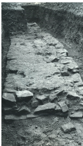
Základy hradební zdi toušeňské tvrze odkryté při archeologickém výzkumu v roce 1978.