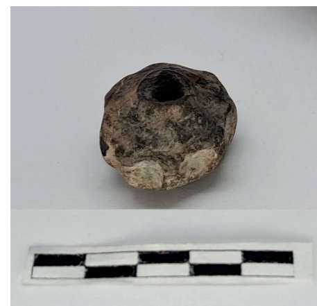
Keramická nádoba, železný hrot kopí a přeslen, nalezené v Toušeni na germánském pohřebišti z 6. století po Kristu.

Velmi zajímavé propojení archeologických a historických poznatků se starými pověstmi českými (byť z logiky věci těžko překračující hranice lépe či hůře podložených domněnek) nedávno publikoval mezitím bohužel zesnulý historik Petr Charvát. Zatímco Praotec Čech je podle něj pouze fiktivní postavou, Krok, Kazi a Teta mohou být legendárními vládci některé z neslovanských skupin žijících v české kotlině. Kazi a Teta byli ovšem mužského pohlaví a Krokovy dcery z nich učinil až kronikář Kosmas začátkem 12. století. Rovněž údajná třetí Krokova dcera Libuše se jmenoval(a) Luboša, který následoval v seznamu vládců po Tetovi jako první předák se slovanským jménem. Lubošovo pohlaví bylo přepólováno na ženské již dávno před Kosmou, posloužilo totiž k napojení Přemyslovců na zmíněný seznam vládců tím, že došlo k posvátnému spojení Libuše zosobňující pospolitosť „Pračechů“ a Přemysla jako zakladatele panovnické dynastie. Faktem je, že za celou dlouhou dobu vládnutí Přemyslovců nikdy nikdo seriózně nezpochybil jejich právo na trůn. Dokonce ani Vršovci ne... (pokračování příště)