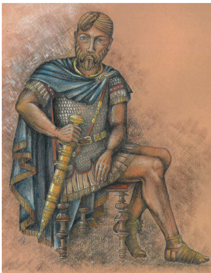
Marobud, nejstarší jménem známý obyvatel české kotliny. Ilustrace Lenky Káčové z obálky knihy Eduarda Droberjara Příběh o Marobudovi a jeho říši, vydalo nakladatelství Set Out v roce 2000.

V podstatě jedinou, avšak dosti výraznou stopu zanechali Germáni v Toušeni v okolí bývalé Jandovy cihelny (jižně od současného hřbitova). Zde v první polovině 6. století pohřbívali své zesulé. Postupně tu bylo objeveno asi deset hrobů (jak kostrových, tak žárových) a jejich celkový počet je odhadován až na padesát – množství jich bylo zničeno provozem cihelny. Vedle lidských ostatků hroby obsahovaly rovněž průvodní materiál, konkrétně keramiku, železné nože a nůžky, hrot šipky, bronzovou jehlicí, kamenný korál či kostěný hřeben. Ještě větší pohřebiště z téhož období (fungovalo ovšem delší dobu) bylo odkryto v prostoru mezi Čelákovci a Zálužím, kde je počet hrobů odhadován na více než sto (včetně známého pohřbu jezdce s koněm). Význam zálužského pohřebiště dokresluje fakt, že původně byl pozdní stupeň doby stěhování národů v archeologické terminologii označován jako čelákovický typ.