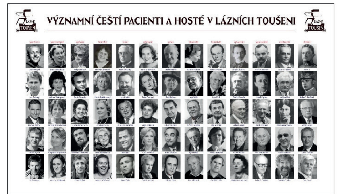
tablo pětadesáti významných osobností