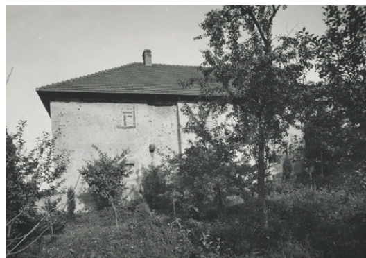
Toušeňský mlýn v roce 1938