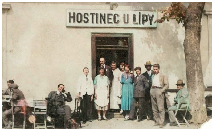
Hosté před toušeňským hostincem U lípy