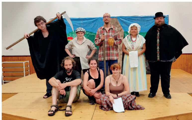
Pohádka z Rokycan: Jak hrobař přelstil smrt (v neděli 16. dubna v 10:30)