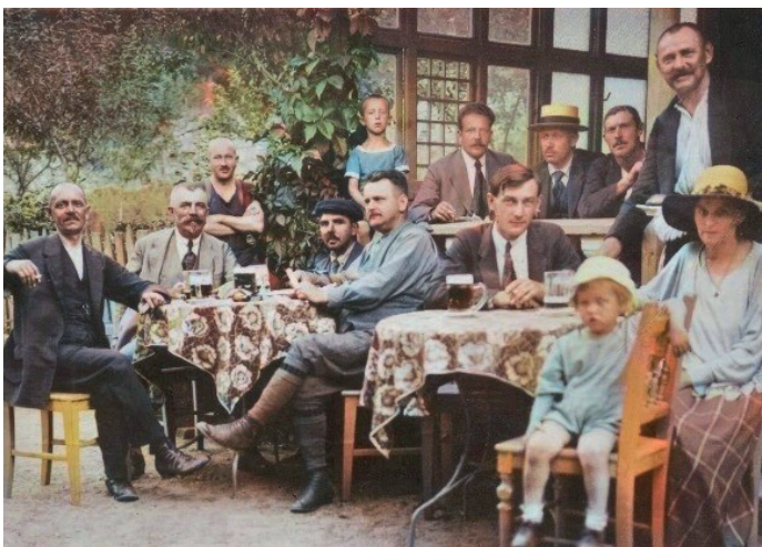
Hosté v zahradní restauraci U Wallianů