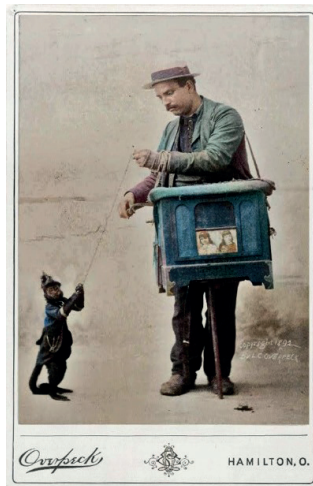
Kolovrátkář s opičkou na obrázku z roku 1892 v Hamiltonu v Ohiu, USA

Jestli kolovrátkáře někdo obrátil botou, nebo ho přetáhl za jeho hudební výkon kli-