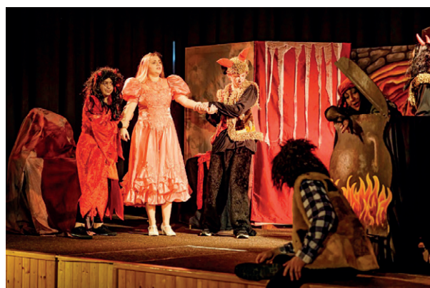
Pohádka z Třeště: Bětuška a Kleofášek (v sobotu 15. dubna v 10:30)