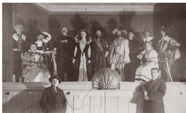
7. ledna 1823 Bělohorská mračna v sokolovně