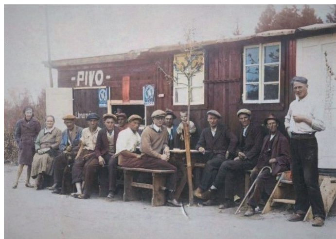
Tak se chodilo v Toušeni na pivu