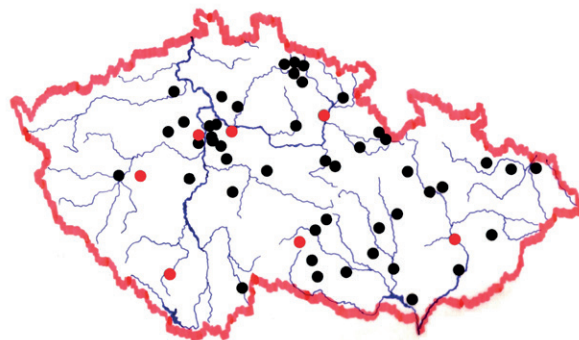
Sídla tělocvičných jednot Sokol, jejichž soubory se zúčastnily alespoň jedné z národních přehlídek sokolských divadel; červeně jsou vyznačena místa letošních účastníků.