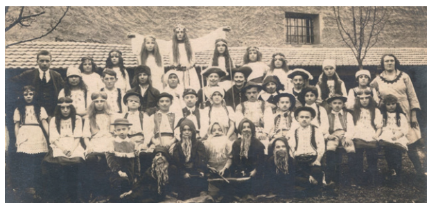
4. února 1923 Janošík na dvoře U Salačů