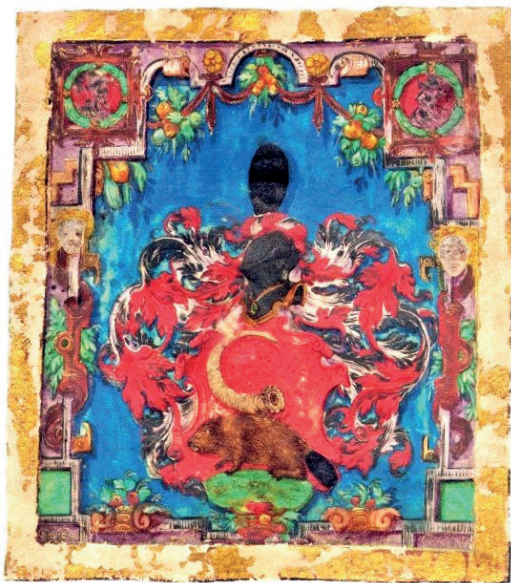
Erb toušeňského mlynáře Cypriána Roudnického z Mydlovaru, 1561