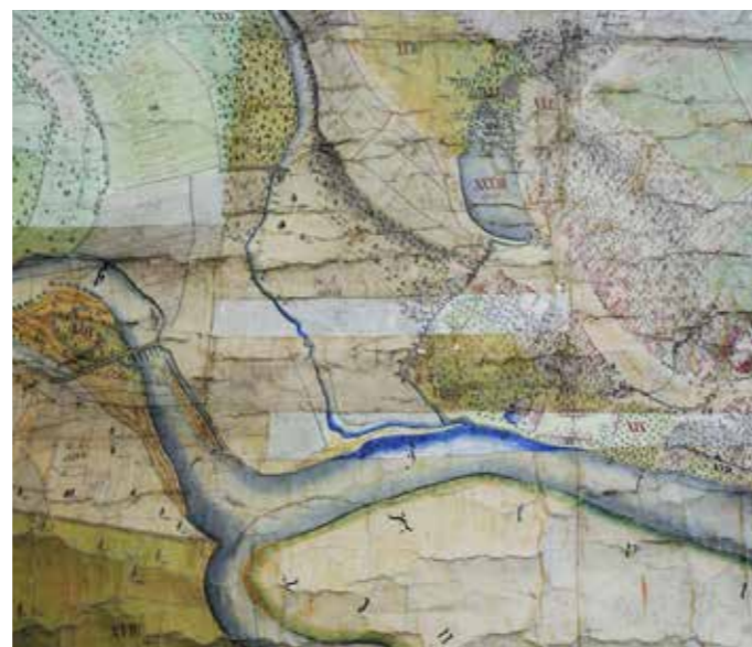
Výřez z raabizační mapy Toušeně autora Josefa Mühlsteina z roku 1777, sever dole [Státní oblastní archiv v Praze, fond Velkostatek Brandýs nad Labem, inv. č. 3647]

Bez mostu se Toušeň obešla dalších více než dvě stě let, současná lávka byla postavena na přelomu milénia v letech 1999-2001.