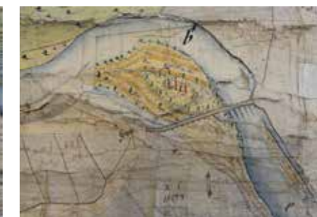
Výřez z raabizační mapy Toušeně, detail zadního mostu přes hlavní rameno řeky