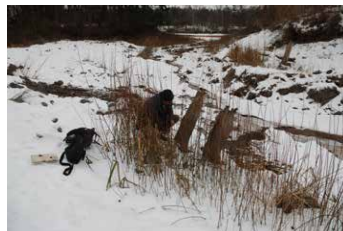
Průzkum dřevěných pilotů na dně vypuštěné vodní nádrže Malvíny v lednu 2017

Historii toušeňského mostu byla ve Floriánovi již opakovaně věnována pozornost, a tak nyní shrňme jen to nejpodstatnější. Dřevěný most, lépe řečeno mosty, neboť přemostění Labe v Toušeni sestávalo minimálně ze dvou mostů (někdy se hovoří dokonce o třech), byl postaven nákladem královské komory, pod jejíž správou brandýské panství od roku 1547 náleželo, v letech 1561-1562, třebaže záměr k jeho vybudování byl deklarován již v roce 1553. Most nahradil přívoz doložený zde již v roce 1293 – právě v Toušeni totiž překonávala Labe jedna z větví staré obchodní trasy z Prahy do Kladska a Vratislavi, zvané polská, slezská či kladská cesta. Osudy mostu byly pohnuté, vedle opakovaných škod způsobených řekou Labe (povodně, ledové kry) byl most několikrát ze strategických důvodů poškozen vojáký během dobových válečných konfliktů (třicetiletá válka, slezské války) – vždy však byl obnoven. Až souběh dalších nepříznivých okolností, tedy přeložení trasy slezské pošty na jinou větev polské cesty a opětovné poškození řekou, uzavřel někdy v 70. či 80. letech 18. století více než dvousetletou éru fungování toušeňského dřevěného mostu, který byl nahrazen znovu přívozem.