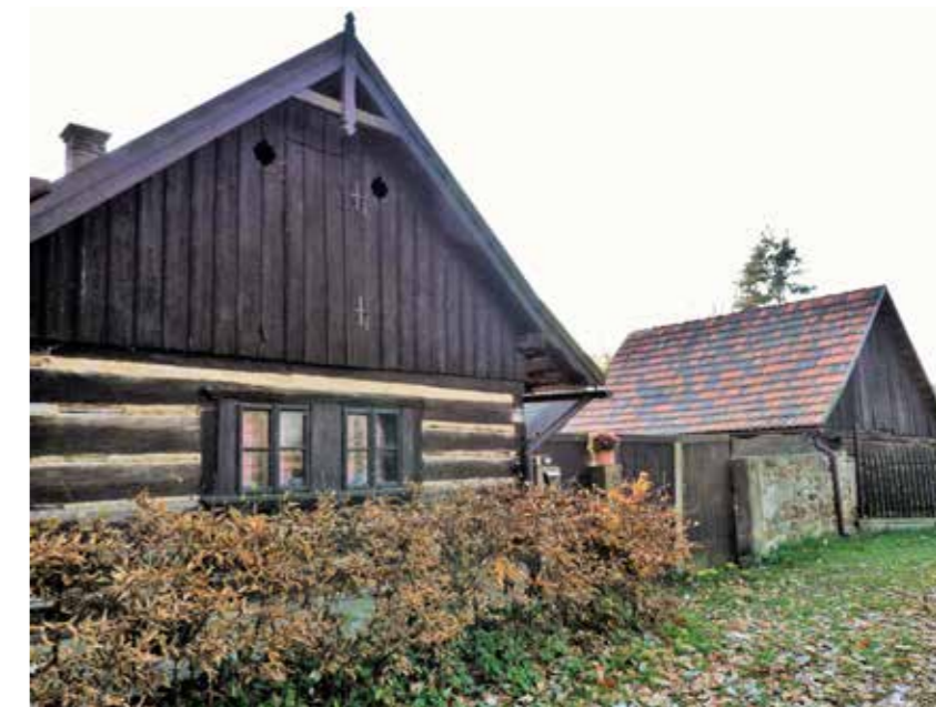
Roubenka a špýchar číslo 43