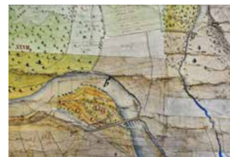
Výřez z raabizační mapy Toušeně, detail obou mostů, vpravo nahoře přední pod Hradištěm, dole uprostřed zadní přes hlavní rameno Labe [Státní oblastní archiv Praha, inv. č. 3647]