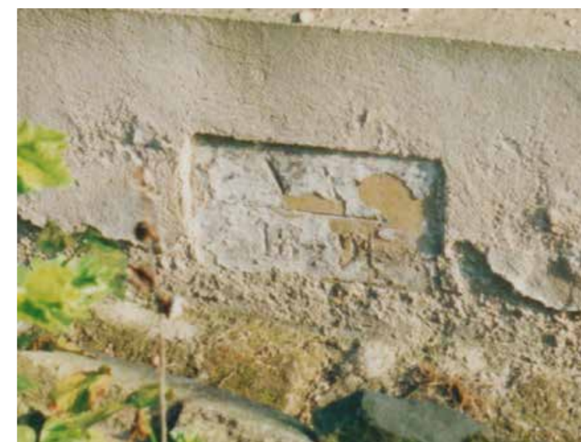
Ryska velké vody 1891 na podezdívce roubenky číslo 43