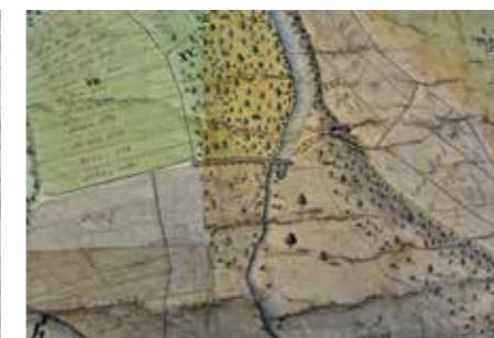
Výřez z raabizační mapy Toušeně, detail předního mostu pod Hradištěm