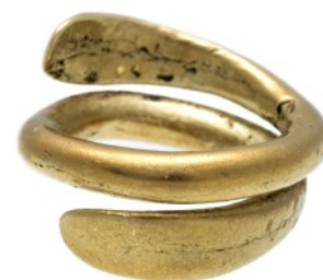
Spirálovitá zlatá záušnice (ozdoba vlasů), údajně již z období řivnáčské kultury (sbírka: Městské muzeum v Čelákovcích,)