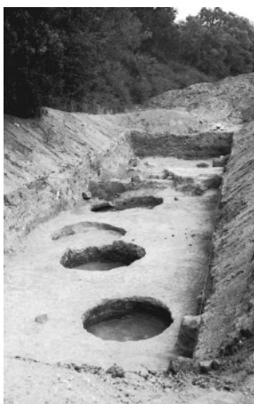
Archeologický výzkum na Hradištku 1981

Na nevysokém protáhlém ostrohu na východním okraji městyse Lázně Toušeň, nad bývalým ramenem řeky Labe, leží pozůstatky pravěkého a raně středověkého hradiště . Lokalita (rejstř. č. ÚKSP 30371/2-2215, katalog. č. 1000141811) je památkově chráněna od 3. 5. 1958. Do státního seznamu kulturních památek byla lokalita zapsána 31. 12. 1966, rozsah památky byl revidován. Předmětem ochrany jsou archeologické stopy na vymezených pozemcích.