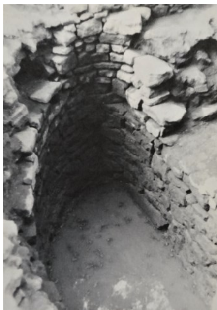
Vodní nádrž ze 13. století odkrytá při výzkumu v roce 1978

Výzkum potvrdil lokalizaci opevněného sídla, známého i z písemných pramenů, upřesnil dobu jeho vzniku do druhé poloviny 13. století a rozlišil dvě vývojové stavební fáze. Z té starší (před rokem 1300) výzkum odhalil zejména základové zdivo a cisternu na vodu, z mladší pak základy hradebního zdiva. V mladší fázi lze sídlo popsat jako objekt chráněný vodním příkopem a zděnou hradbou (šíře 180 cm) přibližně kruhového tvaru o vnitřním průměru necelých 40 metrů. Spolu se zlomky keramických nádob byly výzkumem získány i gotické a renesanční pískovcové architektonické články, zlomky kachlů, dlaždic, prežů a břidlicové střešní krytiny, stříbrné mince, železné hřeby a podkovy či skleněné zlomky číší a okenních terčíků – vše z 13.–16. století (sídlo zaniklo v 17. století).