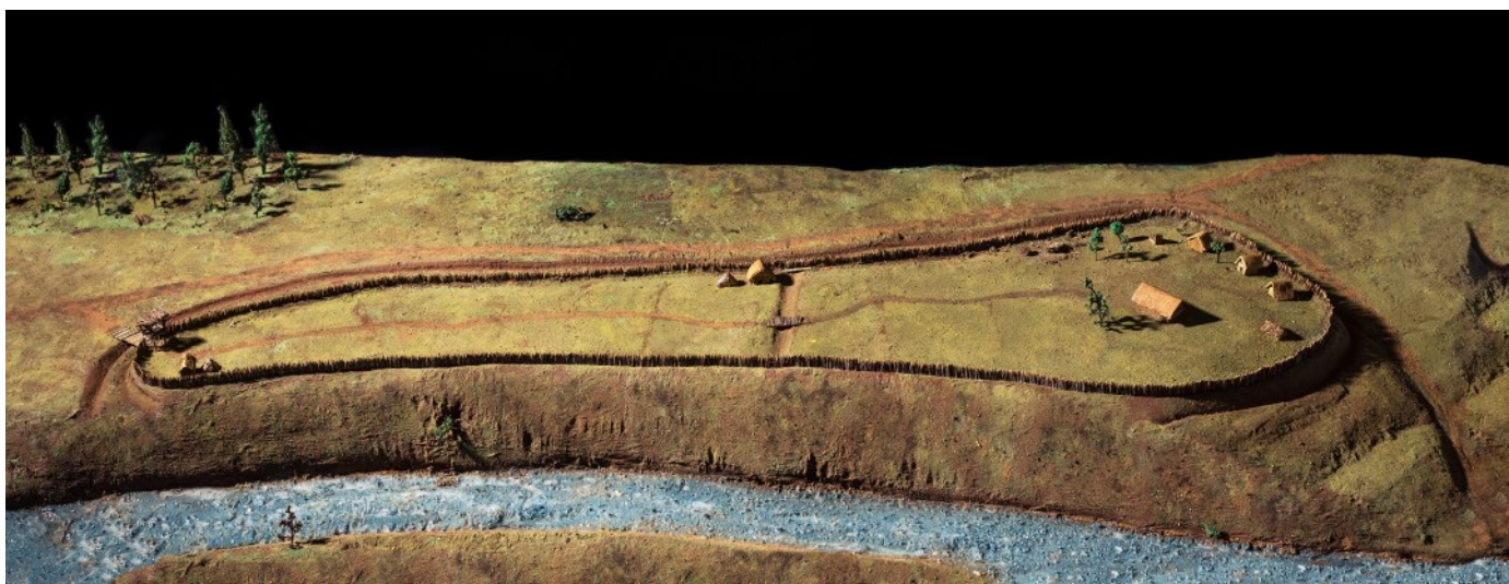
Jedna z možných podob toušeňského hradiště v raném středověku (model: Městské muzeum v Čelákovcích)