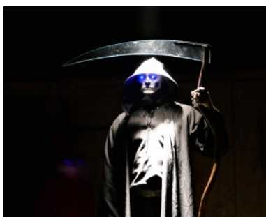
Smrt Vojtěch Zíta

Napůl touha, napůl vzdor dospěly v hrdinský čin – ve čtyřladvacáté provedení inscenace Pratchettova Morta toušeňským divadelním spolkem.