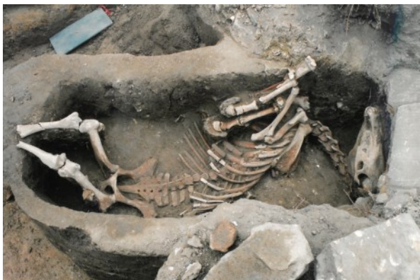
Kostra koně uhynulého v 16. století, objevená výzkumem z roku 2007