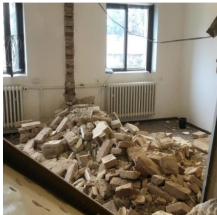
tak vzniká velký hotelový pokoj s koupelnou