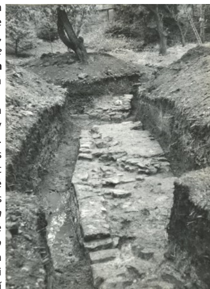
Základy hradební zdi odkryté při výzkumu v roce 1978

Pozorní čtenáři si všimli, že jsme se dosud vyhýbali jednoznačnému zařazení toušeňského opevněného sídla mezi hrady nebo mezi tvrze. Hranice těchto pojmů je ale neostrá a také pokus o zavedení pojmu hrádek nepřinesl kýžený výsledek, neboť vedl pouze k tomu, že namísto jedné nejasné hranice vznikly dvě... Ani dobové prameny nejsou v označení sídla jednotné. Příznačné je též uvedení Toušeně jak v Durdíkově encyklopedii hradů, tak v Úlovcově encyklopedii tvrzí. Je-li jedním z rozdílů mezi hradem a tvrzí bližší návaznost druhé z nich na organismus obce, pak bych se klonil k zařazení toušeňského opevněného sídla mezi tvrze. ■